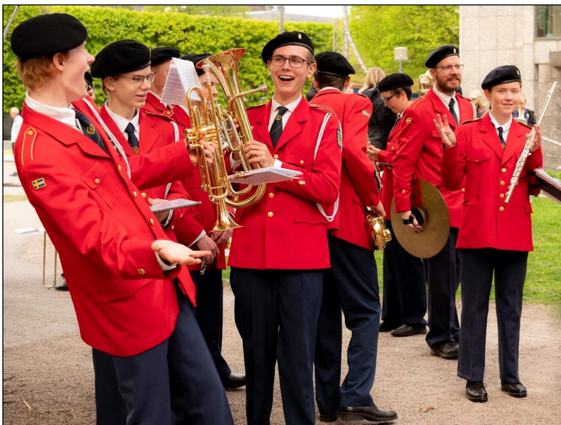
Bild från paraden under MusikRUM 2019

Under 2023 kommer RUM att fortsätta arbetet att stärka förutsättningarna för framtiden och att få fler och fler unga att hitta till eller tillbaka till RUM efter åren med Covid-19 restriktioner.