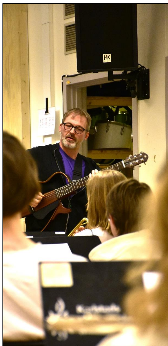
Bild från MusikRUM i Karlstad

Tidigare år har RUM i stort tagit del av projektet Musikhjälpen som med hjälp av musik och glädje genomför ett humanitärt bidragsarbete. De gör detta genom att samla in pengar som sedan skickas till människor i olika typer av utsatta situationer världen över. Om möjlighet ges och resurser finns önskar RUM Örebro ta del av arbetet som Musikhjälpen gör, på ett eller annat sätt. Tidigare år har distriktet varit med och arrangerat konserter där alla inkomster oavkortat har gått till Musikhjälpen.